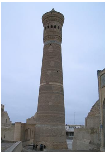
1-súwret. Minarı Kalannıń 2021 jıldıǵı jaǵdayı

Ózbekstan xalqınıń ulıwma-milliy baylıǵı esaplanatuǵın mádeniy miyraslarımızdı qorgaw, YuNESKOning Umumjahon materiallıq miyrasları dizimine kirgen Buxara, Samarqand, Xiva hám Shahrısabz qalalarınıń tariyxıy arxitekturalıq esteliklerin ilimiy úyreniw olardan aqılǵa say paydalanıw hám elimizdiń turistik potencialın asırıwımız kerek.